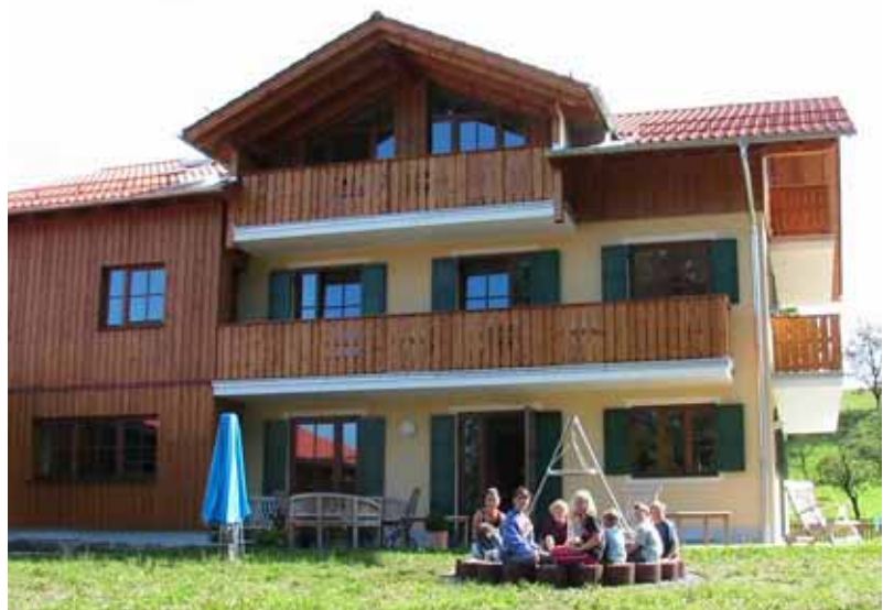
unter einem Dach