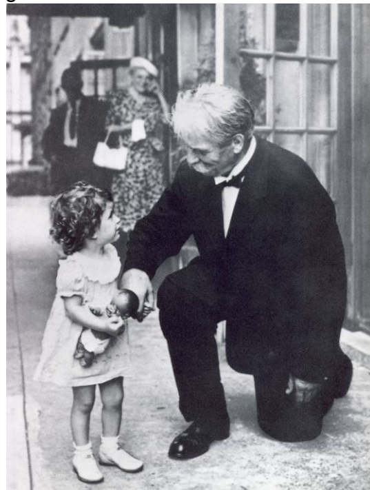
„Ehrfurcht vor dem Leben“

Der Tropenarzt, Theologe, Kulturphilosoph, Musiker und Friedensnobelpreisträger Albert Schweitzer ist in unserer Arbeit mit den Kindern Wegbegleiter und Vorbild.