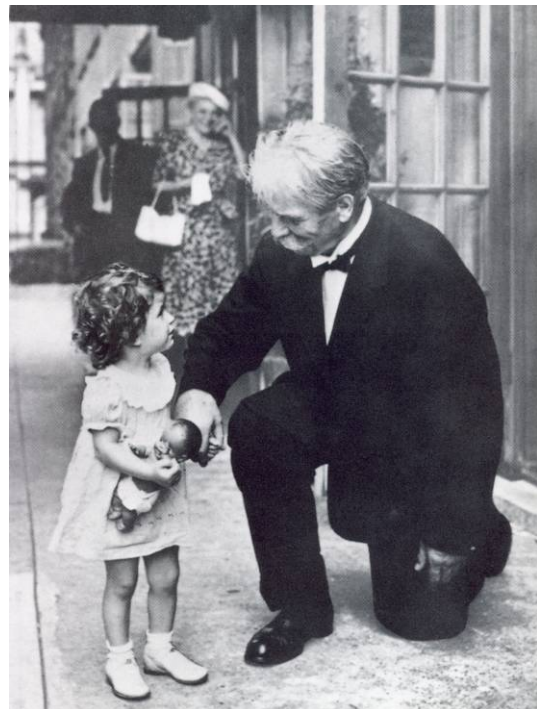
„Ehrfurcht vor dem Leben“

Der Tropenarzt, Theologe, Kulturphilosoph, Musiker und Friedensnobelpreisträger Albert Schweitzer ist in unserer Arbeit mit den Kindern Wegbegleiter und Vorbild.